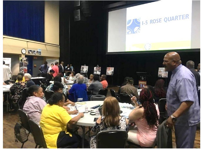
社區民眾在公開說明會中進一步瞭解計劃相關資訊並提供回饋意見。